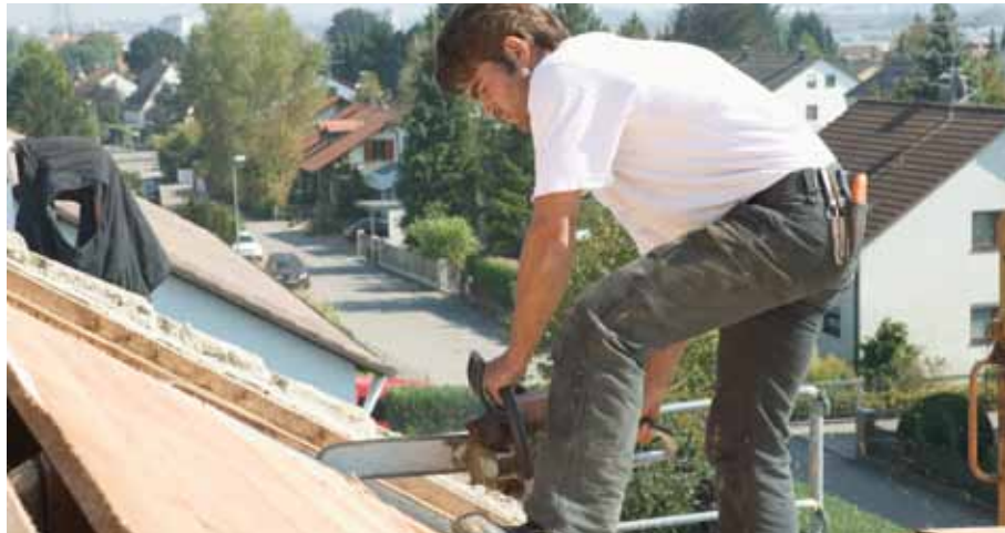
Bei der Absetzbarkeit von bar bezahlten Handwerksleistungen scheint Einspruch Erfolg versprechend

Es kommt immer wieder vor, dass Gerichte schon verabschiedete Steuergesetze kippen. Wer neben den eigentlichen Klägern davon profitieren möchte, sollte seinen Steuerbescheid durch Einspruch offenhalten lassen.