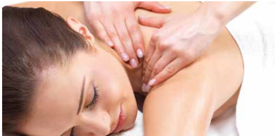
Auch Massagekosten fallen jetzt unter die Steuerfreiheit

Leistungen des Arbeitgebers zur Verbesserung des allgemeinen Gesundheitszustands und der betrieblichen Gesundheitsförderung von Arbeitnehmern sind bis zu einem Betrag von 500 Euro im Jahr steuerfrei.